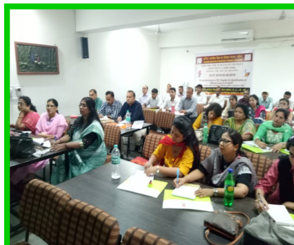
Workshop for PGT English