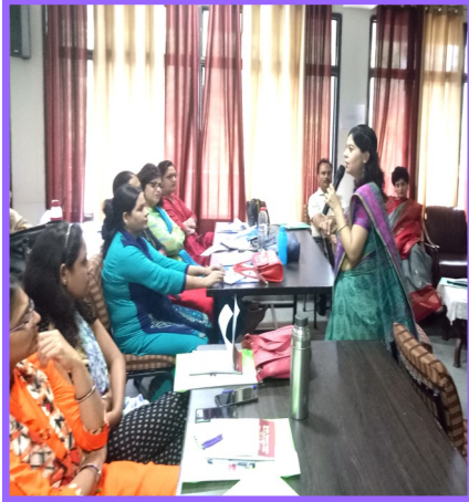
सम्प्रेषण योग्यता की कार्यशाला