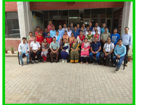
पी जी टी कम्प्यूटर विज्ञान हेतु कार्यशाला