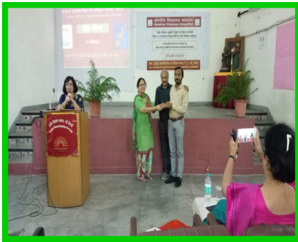
पी जी टी हिन्दी की कार्यशाला