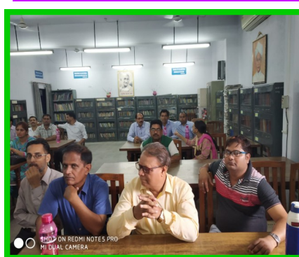
In-Service Course for PGT Phy