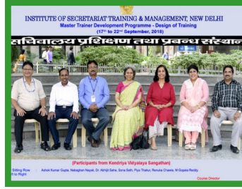
DOT at Delhi