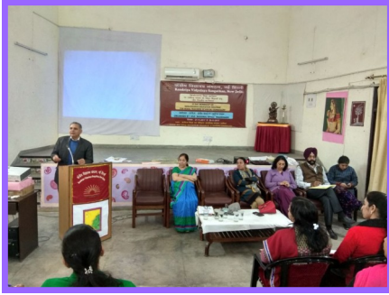
किशोरावस्था शिक्षा कार्यक्रम