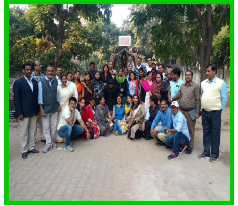
टी जी टी कला शिक्षा हेतु सेवा कालीन प्रशिक्षण