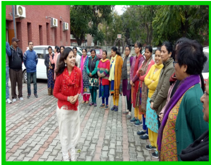
सम्प्रेषण योग्यता की कार्यशाला