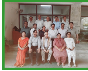
Mentoring Skill at HIPA Gurugram