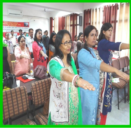
सतर्कता जागरूकता सप्ताह