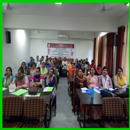
Communication Skill workshop for PRT