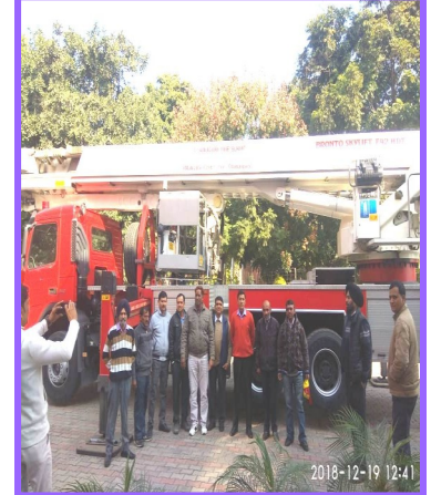
सब स्टाफ हेतु कार्यशाला