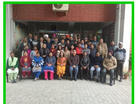
Workshop for Office Staff