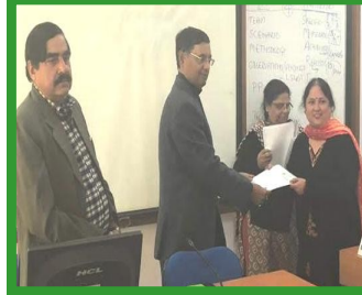
TNA at HIPA