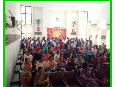
Awaken Citizen Programme