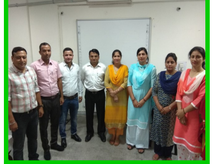
पी जी टी वाणिज्य की कार्यशाला