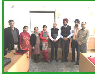
DOT at MGSIPA Chandigarh