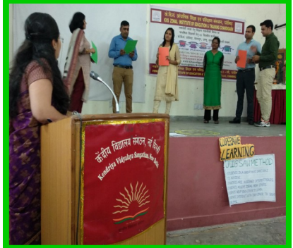
समावेशी शिक्षा कार्यशाला