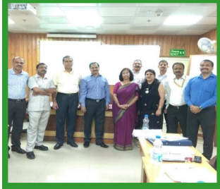
DOT at Delhi