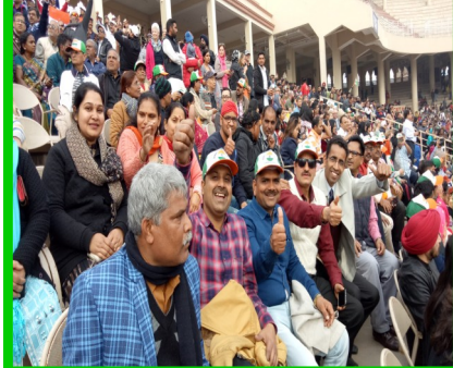
पुस्तकालय अध्यक्षा का बाघा बार्डर भ्रमण