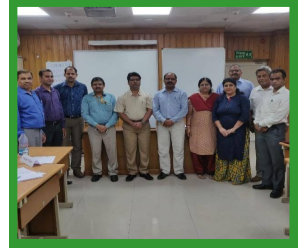
DTS at Delhi