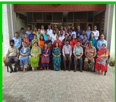
Workshop for PGT Economics