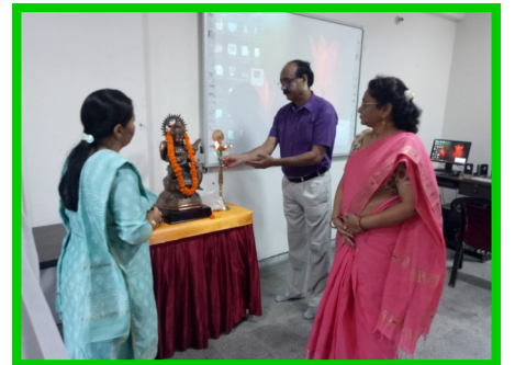
Workshop for PRTs