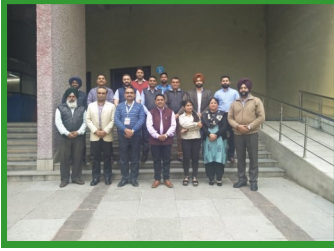
DTS at MGSIPA Chandigarh