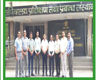
DOT at Delhi

प्रशिक्षण योग्यता को और अधिक निखारने के लिए संस्थान की निदेशिका व सह-प्रशिक्षकों ने कार्मिक विभाग द्वारा आयोजित विभिन्न प्रकार के प्रशिक्षण कार्यक्रमों में भाग लिया ।