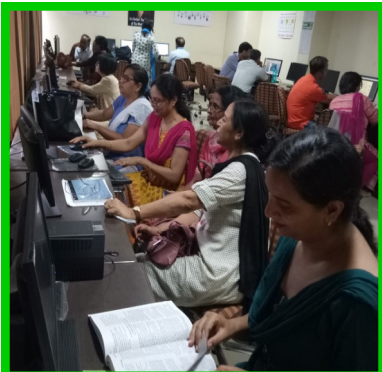
Master Trainer Programme