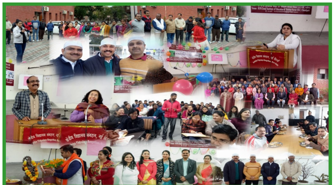
विभिन्न प्रशिक्षण कार्यक्रमों की झलकियाँ