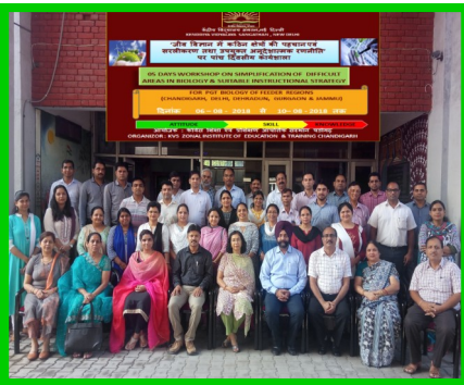
Workshop for PGT Biology