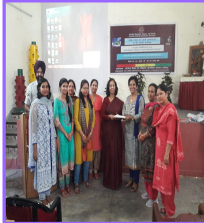
टीजीटी विज्ञान की कार्यशाला