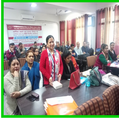
कार्यालय स्टाफ हेतु कार्यक्रम